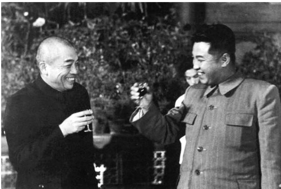
1955年金日成访华，与彭德怀互相敬酒。