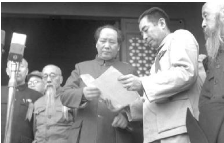
1949年10月1日,毛泽东与周恩来等人在开国大典上。

2013年12月26日,系毛泽东诞辰120周年。对这位影响中国近现代史最巨之人物,做出具体而全面之评价,史料浩繁,殊为不易;但其个人决策,对历史走向之深刻影响,举二三案例,已不难清晰窥见。