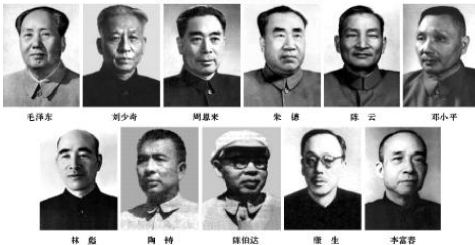
八届中央政治局常委

逐步满足人民日益增长的物质和文化需要。强调要坚持民主集中制和集体领导制度，加强党和群众的联系。这次大会为新时期的社会主义事业的发展和党的建设指明了方向。