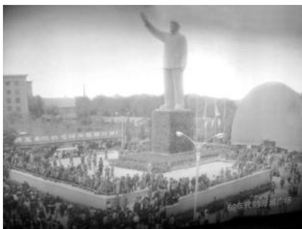
20世纪60年代的新城广场

“文革”初期强调所谓“三忠于四无限”（即“忠于毛主席，忠于毛泽东思想，忠于毛主席的无产阶级革命路线”；对毛主席、毛泽东思想、毛主席的革命路线要无限热爱，无限信仰，无限崇拜，无限忠诚），举国上下都争着以各种方式向毛主席表“忠心”，而佩戴毛主席像章，挂贴毛主席画像，矗立毛主席塑像，一时成为时髦中的时髦：不仅人人胸前佩戴的像章越大越好，许多单位、机关、厂矿、校园和部队营房，都拼命在其最显眼的位置，竖起毛泽东姿态各异的巨幅画（塑）像。似乎不如此，就体现不出对“老人家”的“阶级感情”；不如此，就“生活无指南，前进无方向，工作无动力”，甚至连“吃饭都不香”。