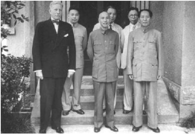
1945年,毛泽东赴重庆参加谈判,与蒋介石等人合影。

有另一层远虑。1949年7月,邓小平曾告诉华东局:“毛主席说,这样是主动的倒,免得将来被动的倒。”